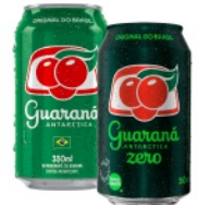
Refrigerante Guaraná Antartica 350ml ( Zero / Tradicional)