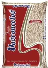
Feijão Carioca Vasconcelos 1 kg

Promoção válida de 02/12/2024 a 31/01/2025. Sorteios para Cooperados Regulamento no site. Certificado de Autorização SPA/ME nº 06.037233/2024