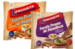
Farofa de Mandioca Anchieta 250g