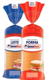
Pão de Forma Seven Boys Tradicional e Leite 450g