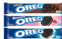
Biscoito Oreo 90g exceto sabor Coca-Cola