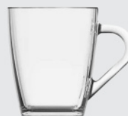
Caneca Nadir Quadre 300ml