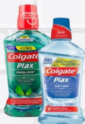
Solução Bucal Colgate Plax 500ml