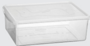
Caixa Organizadora Santana Du Chef c/tampa 11L