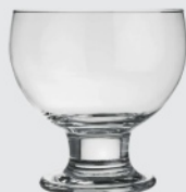
Taça p/ Sorvete Paulista