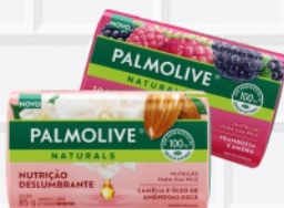
Sabonete Palmolive 85g