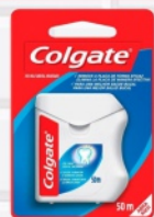
Fio Dental Colgate Nylon 50m