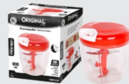
Processador de Alimentos Original Line 900ml