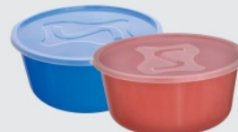
Pote Santana com tampa 5,5L