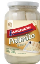
Palmito Anchieta Inteiro 300g