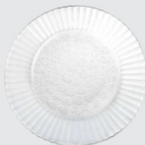
Prato Fundo Duralex Primavera