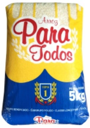
Arroz Para Todos 5 kg