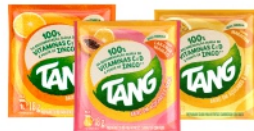
Refresco Tang 18g