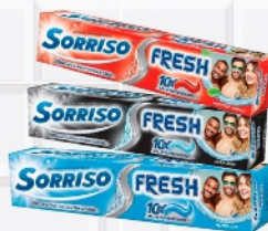
Creme Dental Sorriso Gel Fresh 90g