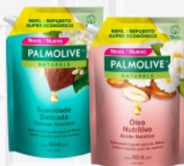
Sabonete Palmolive 900ml