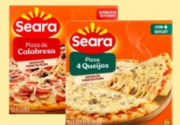
Pizza Seara 460g