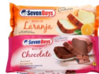
Bolo Seven Boys 250g