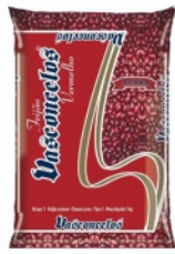
Feijão Vermelho Vasconcelos 1 kg