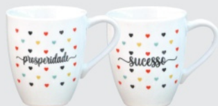
Caneca Glamour Coração 250ml