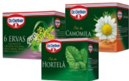
Chá Oetker c/15 sachês