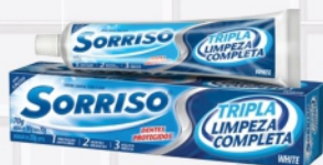
Creme Dental Sorriso Tripla 70g