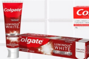
Creme Dental Colgate Luminous White 140g