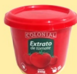
Extrato de Tomate Colonial pote 310g