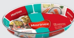
Assadeira Marinex Oval 1,6L