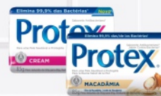
Sabonete Protex 85g