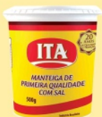
Manteiga Ita 500g