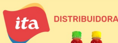
Catchup Colonial 400g Tradicional ou Picante